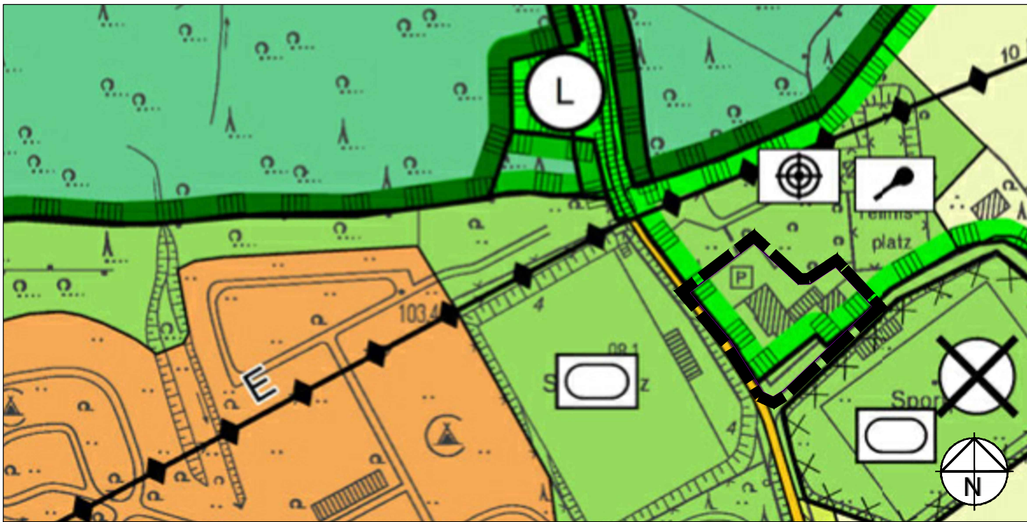
WIRKSAMER FLÄCHENNUTZUNGSPLAN M. 1:2500