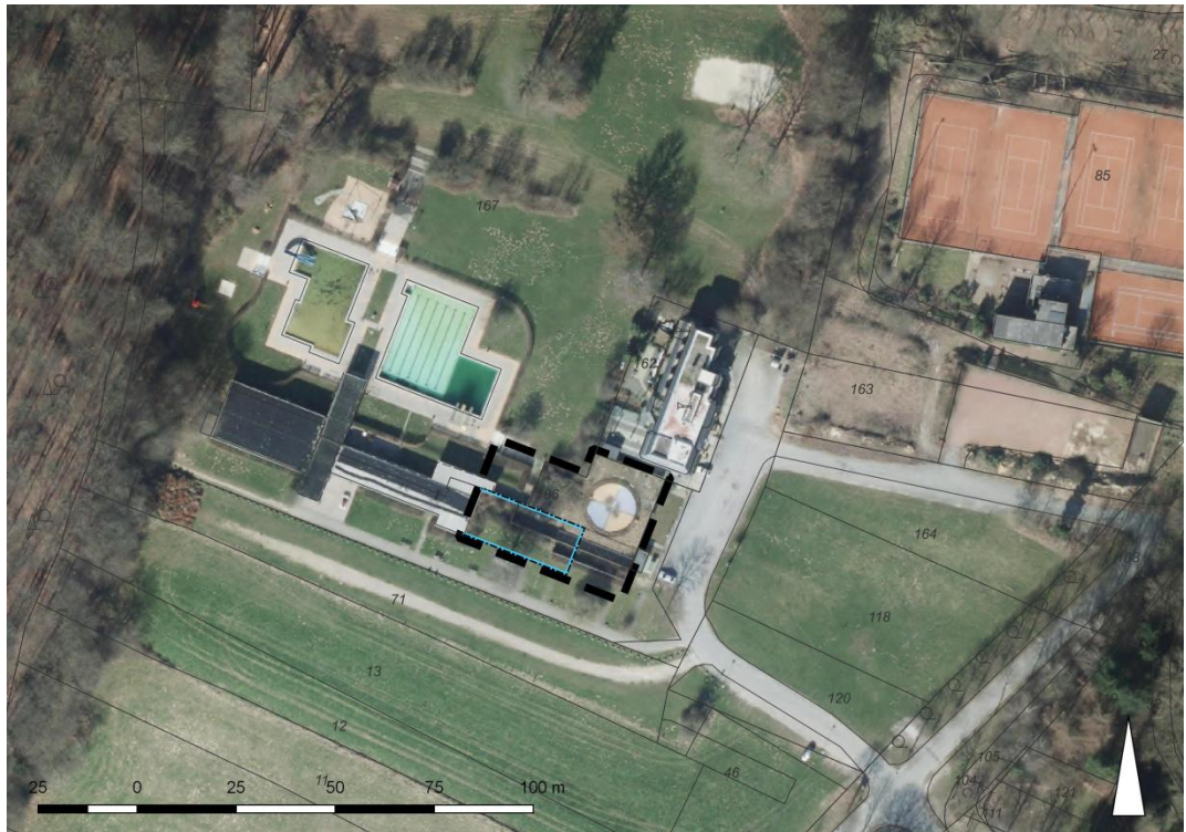
Abb.: aktuelle Nutzung im Plangebiet