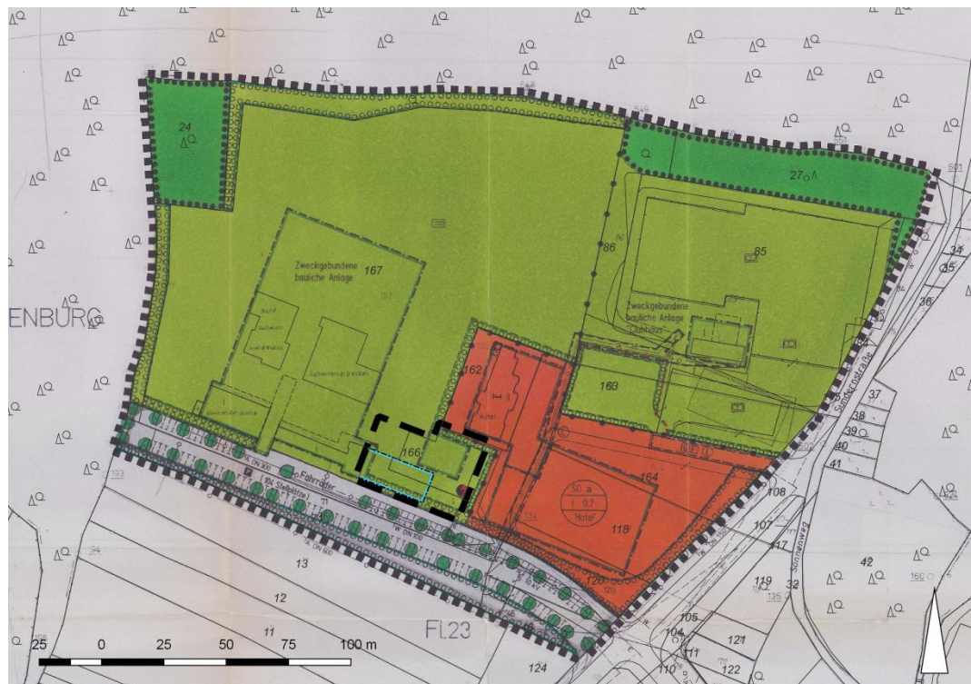
Abb.: Lage der 4. Änderung im Bebauungsplangebiet Nr. 6

Lage: Der Bebauungsplan Nr. 6 befindet sich am nördlichen Ortsrand der Stadt Tecklenburg an der Straße Handal . Der Änderungsbereich liegt im südlichen Teil des Bebauungsplanes Nr. 6.